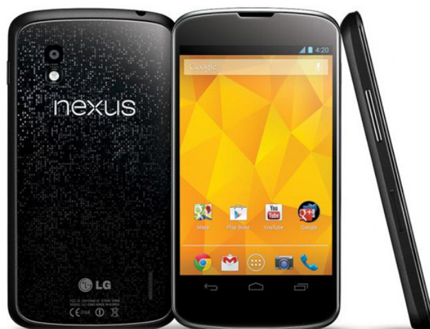
Google Play ikona na Android mobilnem telefonu